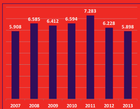
Grafiek 1: Aantal afgiften opsporingsbevoegdheid

In Nederland zijn ongeveer 25.000 boa's werkzaam. Ruim 10 jaar geleden, in 2001, waren er ongeveer 4.000 boa's minder dan nu. De afgelopen jaren bleef het aantal boa's redelijk stabiel. Dit blijkt ook uit het aantal aktes van opsporingsbevoegdheid dat Justis de afgelopen jaren heeft afgegeven.